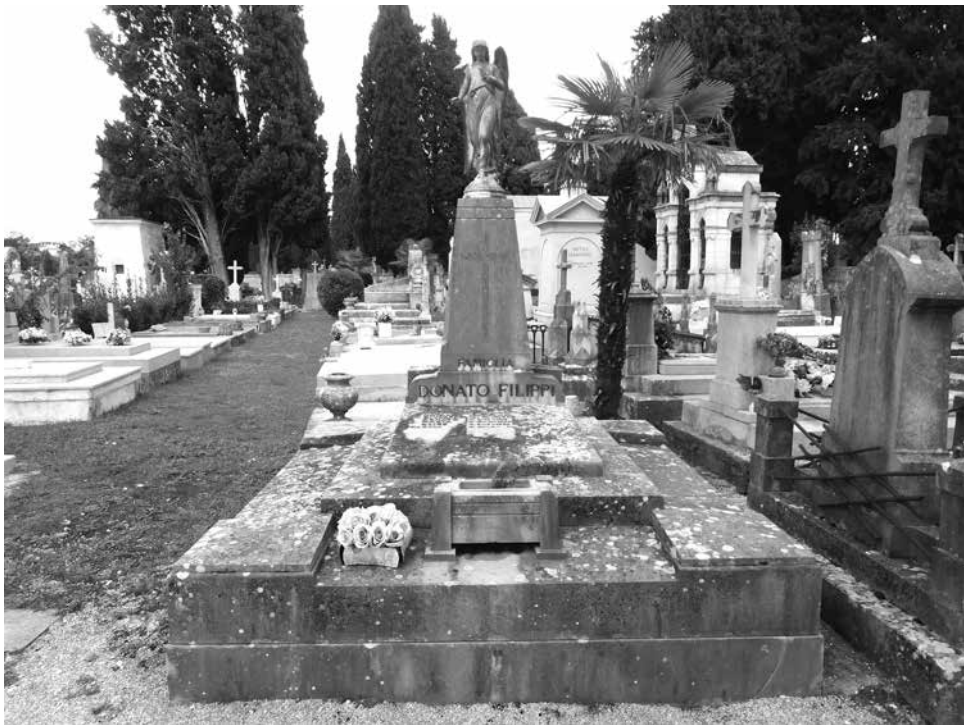
Slika 1. Grobnica obitelji Filippi, Gradsko groblje, Zadar