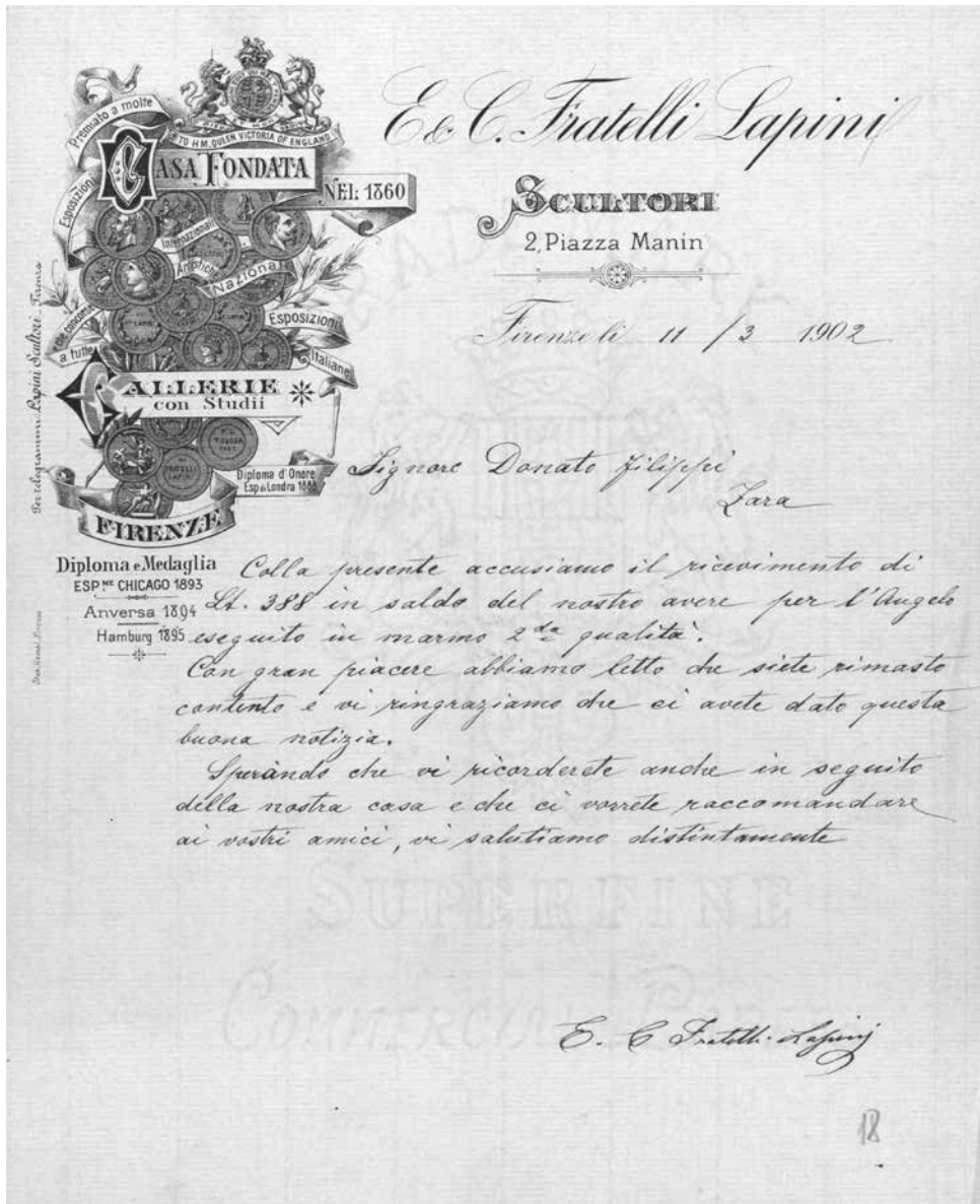
Slika 2. Dopis braće Lapini iz Firence od 11. ožujka 1902. g. upućen Donatu Filippiju. HR – DAZD – 355, Obitelj Filippi, 1746. – 1941., Sign. 154, fol. 18.